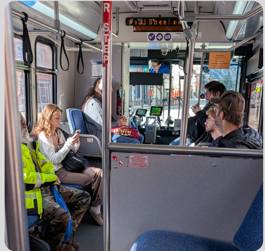
Las alianzas hacen posible operar más servicio de autobús, lo que contribuye a reducir las emisiones de gases de efecto invernadero.

“Sería bueno contar con autobuses más nuevos para las rutas locales. Deberíamos seguir reemplazando los autobuses más antiguos por opciones híbridas o eléctricas. El autobús del aeropuerto suele ser limpio y cómodo.”